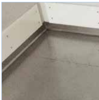
HACCP-Standard, rutschfester Edelstahlboden