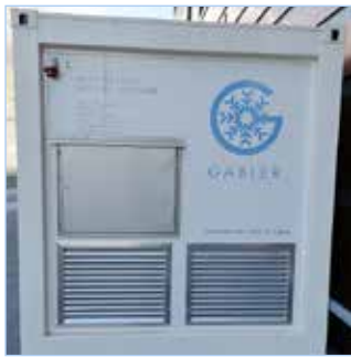
integrierte Kälte- und Elektrotechnik