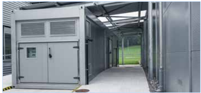
Bau von Sonderlösungen, z.B. Temperaturbereich - 45°C