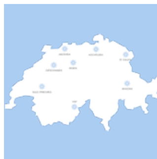
kundennahes Servicenetz 24/7