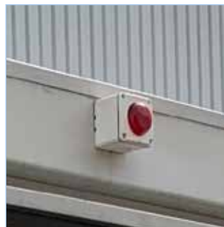
optisch und akustischer Alarm